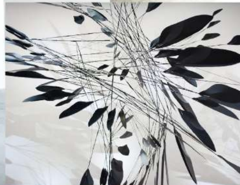
Air Line_モバイル_影_1 | 2019 | Kosei Komatsu カーボンロッドとカーボグラスの羽根のモバイル彫刻です。サイズに対して非常に軽量なため、空間の風によってゆったりと回転します。

江戸時代の地図は浮世絵で培われた木版技法が活用され、世界に類を見ない摺物の美を有し、明治初期の地図は精緻な銅版の刻と透明感ある色彩によって新時代の清冽な空気を今に伝えています。今回、いにしへの地図の上に、小松宏誠による、現代の素材や道具と手仕事を組み合わせたモバイル作品を浮かべることで、まだ誰も聴いたことのないハーモニーを生み出します。