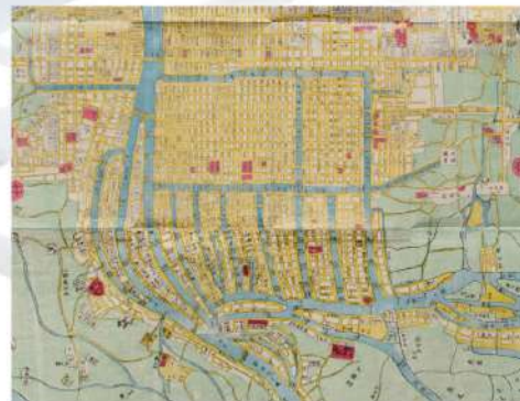
「慶應改正 大阪再見全圖」慶應元年(1865) 木版色摺による大阪図。在りし日の水の都市、大阪を想う。