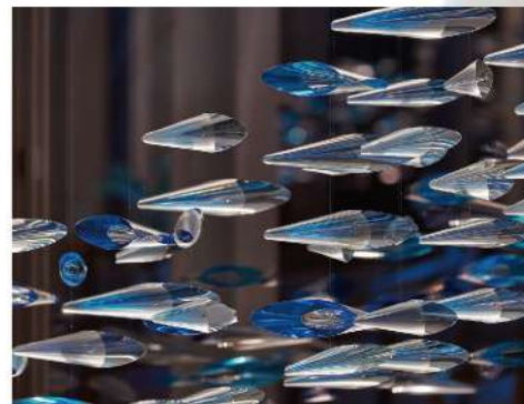
SEA (波のモバイル) | 制作中 | Kosei Komatsu Studio 「きらめく海」からインスピレーションを得たモバイル。※写真はイメージです。