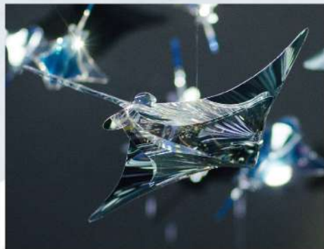
RAY (エイのモバイル) | 制作中 | Kosei Komatsu Studio 水中を優雅に飛ぶ「エイ」の姿からインスピレーションを得たモバイル。※写真はイメージです。