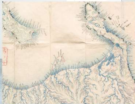
松浦竹四郎「東蝦夷 山川地理取調圖」万延元年(1860) 幕末期に6度にわたり蝦夷を調査した松浦による北海道の区分図。

1981年徳島県生。2006年東京藝術大学大学院修了後、アーティストグループ「アトリエオモヤ」のメンバーとして活動を開始。2014年に独立。現在、美術館での作品展示をはじめ、商業施設やコンセプトショップなどの空間演出も精力的に行う。